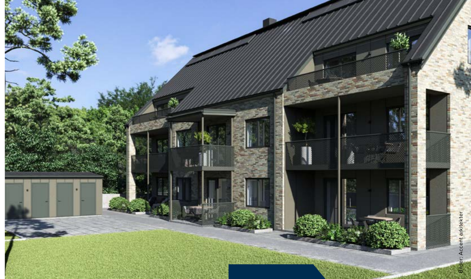
Bilder: Accent arkitekter