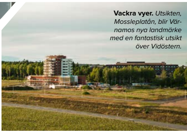
Vackra vyer. Utsikten, Mossleplatån, blir Värnamos nya landmärke med en fantastisk utsikt över Vidöstern.