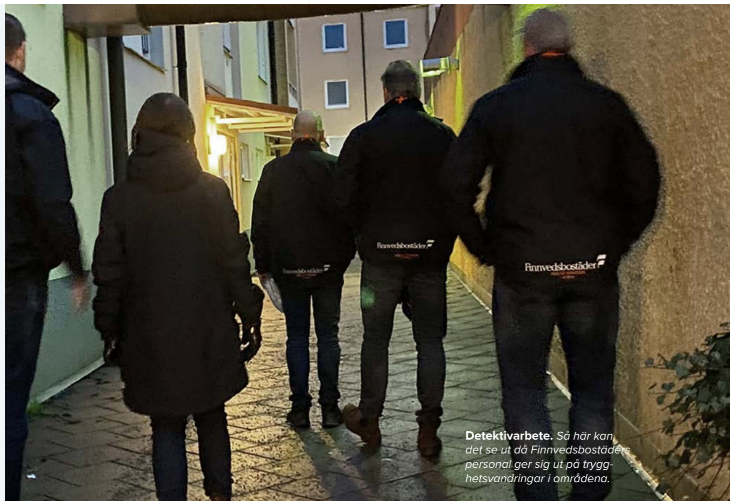
Detektivarbete. Så här kan det se ut då Finnvedsbostädernas personal ger sig ut på trygghetsvandringar i områdena.