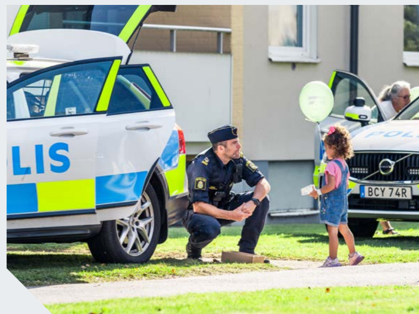
På plats. Att få titta in i en riktig polisbil är spännande ...