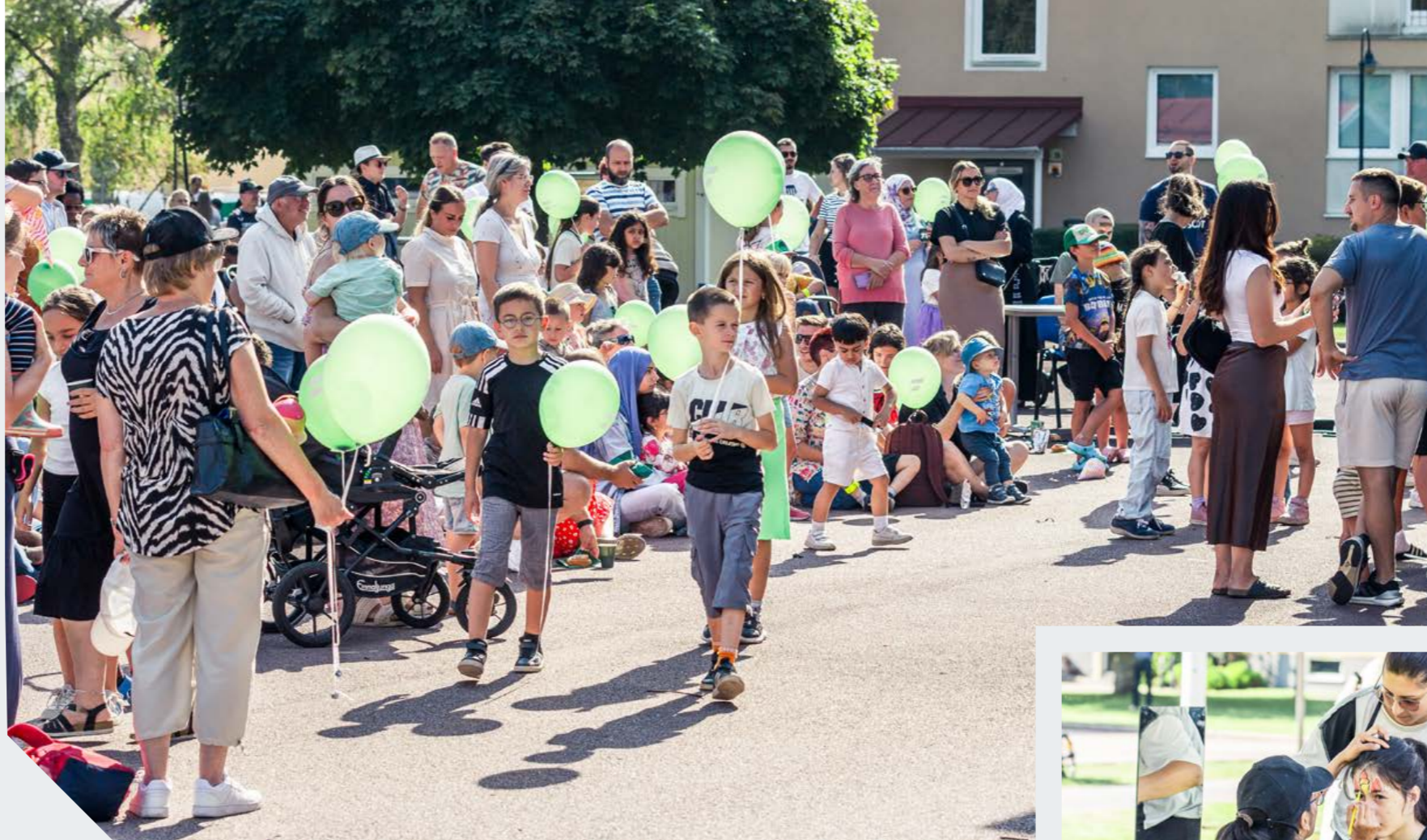
Humöret på topp Årets höstfest blev ett härligt och välbesökt familje-evenemang (ovan).