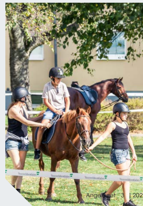
I sadeln. Många passade på att ta en ridtur i bostadsområdet. För många var det första gången.