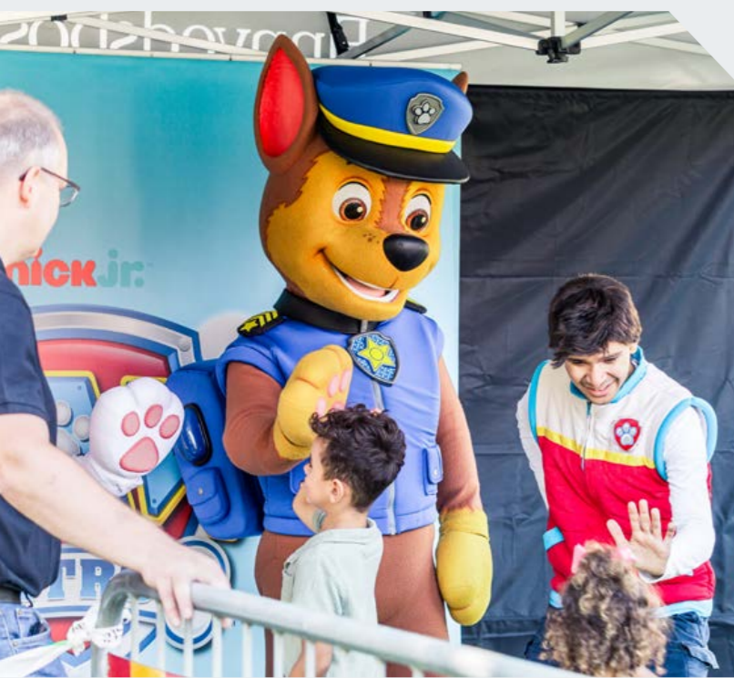
High-five! Många yngre besökare tog chansen att skaka tass med hunden Chase och hans kompisar. Andra passade på att njuta i det fina vädret.